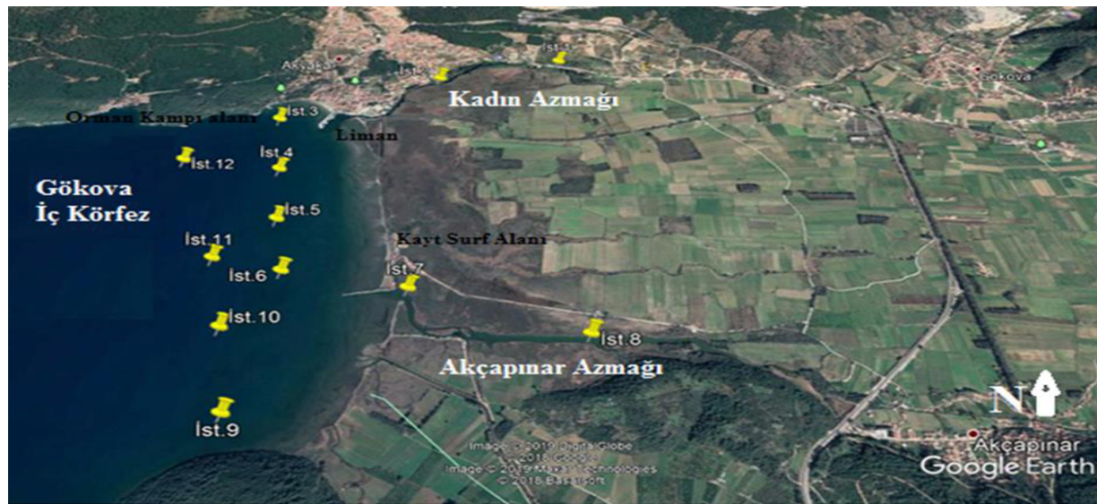
Şekil 1. Çalışma alanı ve istasyonlar