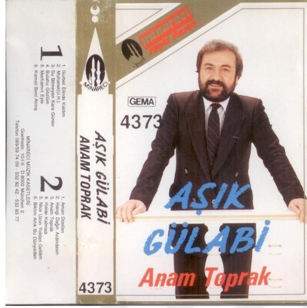
Görsel 8. Anam Toprak adlı albüme ait kaset fotoğrafı