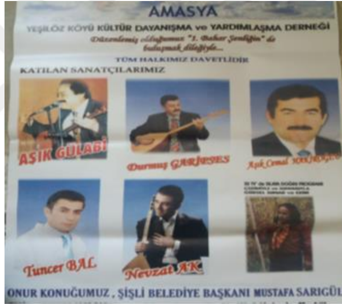
Görsel 1. Âşık Gülabi'nin Amasya'da katıldığı bir şenliğe ait afiş