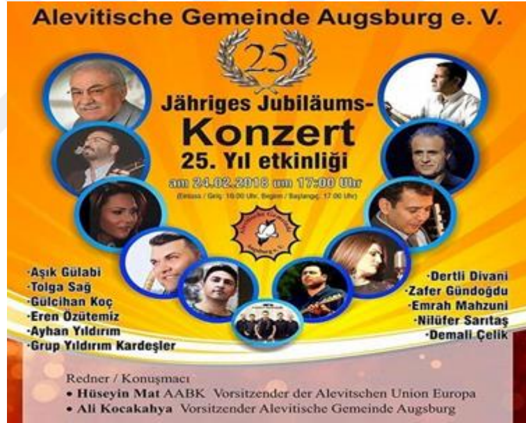
Görsel 9. Aşık Gülabi'nin 2018 yılında Almanya'nın Augsburg şehrindeki Alevi Kültür Merkezi'nin düzenlemiş olduğu etkinliğe ait fotoğraf