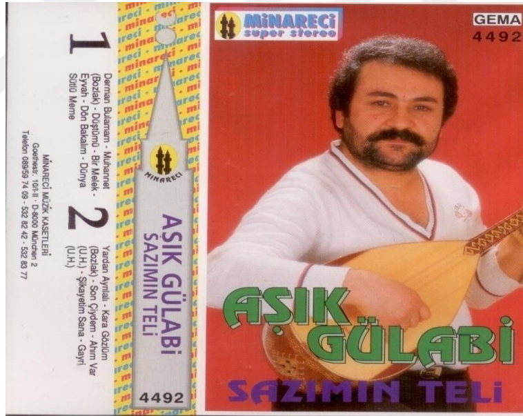
Görsel 5. Sazımın Teli adlı albüme ait kaset fotoğrafı