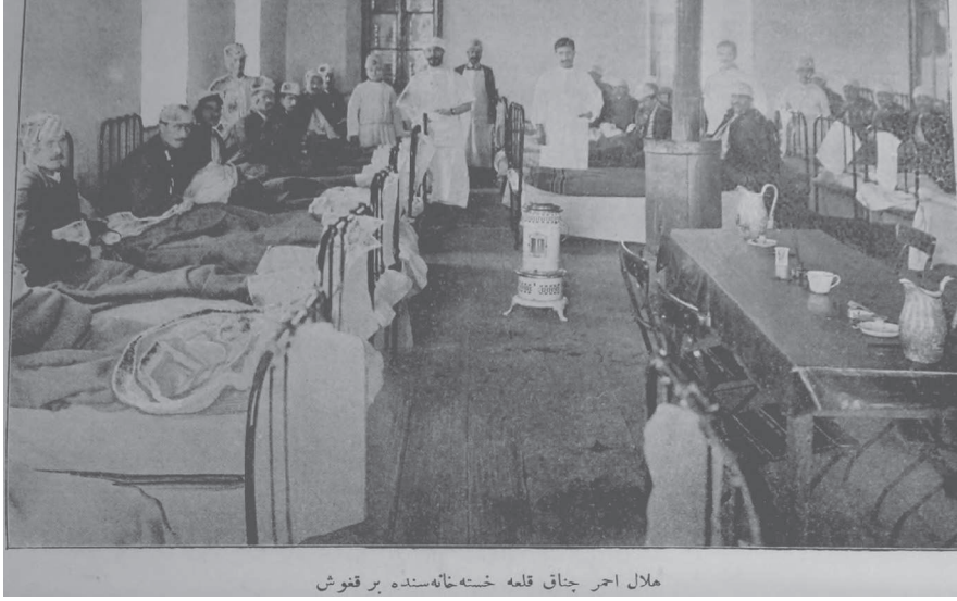
هلال احمر چناق قلعه خسته خانه سنده بر قنوش