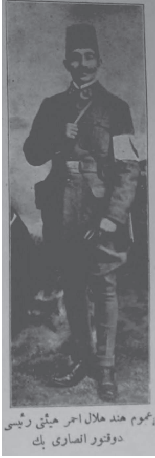
Resim-7 Umum Hint Hilâl-i Ahmer Heyeti Reisi Doktor Ensari Bey