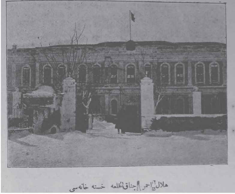
Resim-3 Hilâl-i Ahmer Çanakkale Hastanesi (Şimdiki Öğretmenevi)