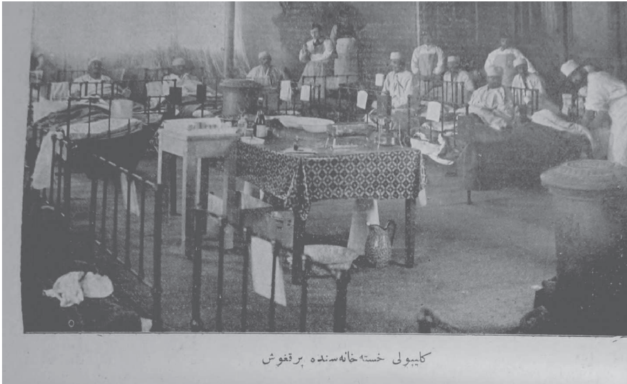
كلیبولی خسته خانہ سنده بر قفوش