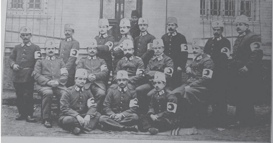
كلیبولی خسته خانہ می او کئده هیئت صحیہ اورتده اوطوران سر طیب او براتور راسم فریدک ، صاغنده دو قنور سداد واحسان عارف بکرا ، صولنده دو قنور