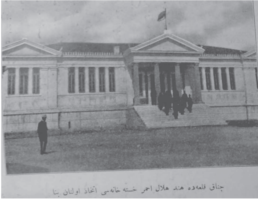
چناق قلعه ده هند هلال احمر خسته خانه می اتخاد اولنان بنا