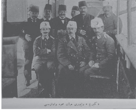
Resim-8 Cambridge Vapuru Heyet-i Sıhhiyesi ve İdaresi