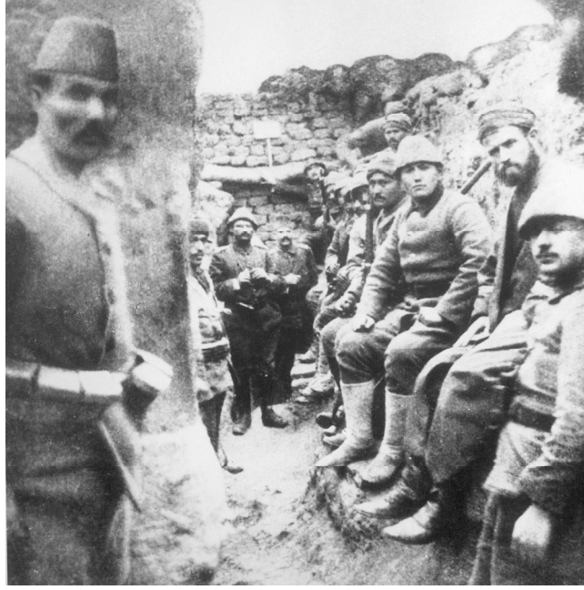
Siperdeki Türk Askerleri

birlikleri tarafından Kayacıkağlı'nda lağım patlatılmış ve bunun sonucu yirmi İngiliz siperinin bozulması sağlanmıştır. 32 Türk birlikleri tarafından bir lağım da 15 Aralık günü Sığındere civarında patlatılmıştır. 33 İngiliz birlikleri Cesarettepe'de patlattıkları iki lağımla 53 Türk askerini şehit etmiştir, 15 asker toprak altından zorlukla çıkarılmıştır. 34