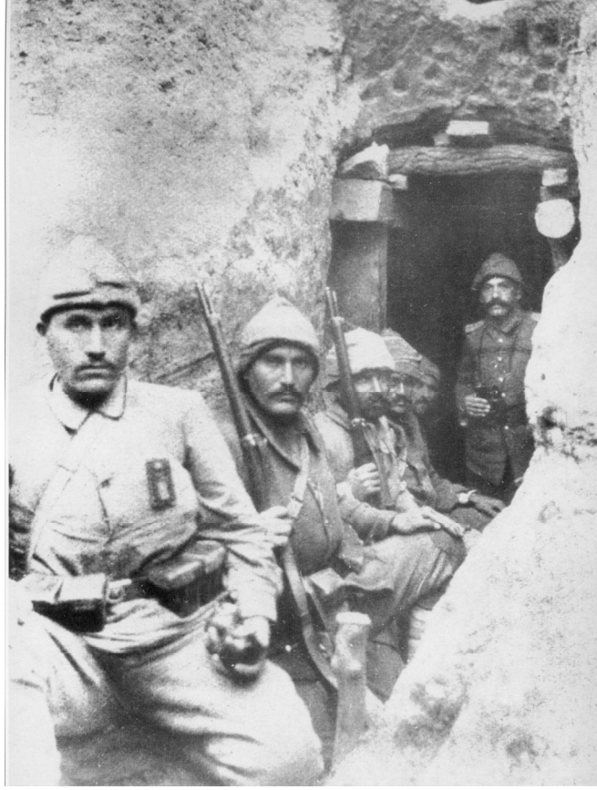
Lağım Faaliyetlerinde Bulunan Türk Askerleri

Çanakkale Cephesi'nde lağım muharebeleri, 28 Mayıs 1915'te, 5. Tümen'in 14. Alayı'nın Bombasirtı'nda patlattığı bir lağım ile Türkler tarafından başlatılmıştır. Bir başka deyişle Çanakkale Cephesi'nde ilk lağım patlatan Türkler olmuştur. Cephedeki bu ilk lağım, Saat 03.30'da, 14. Alay'a mensup Bölük Asteğmeni İhsan'ın (Eriç) tarafından patlatılmıştır. Bunun ardından İngilizlerin Boyun noktasındaki siperlerine 9. Tümen'in 27. Alayı'nın da katıldığı bir baskın yapılmıştır. Bu baskına destek olmak için 3. Tümen'in 64. Alayı'ndan seçilen bir müfreze, İngilizlerin Yükseksirt'taki siperlerine gösterme bir harekâta bulundu ise de çapraz ateş altında kalan bu birlikten sadece 15 kişi dönebilmiştir 7 . Lağım patlatıldıktan sonra başlatılan