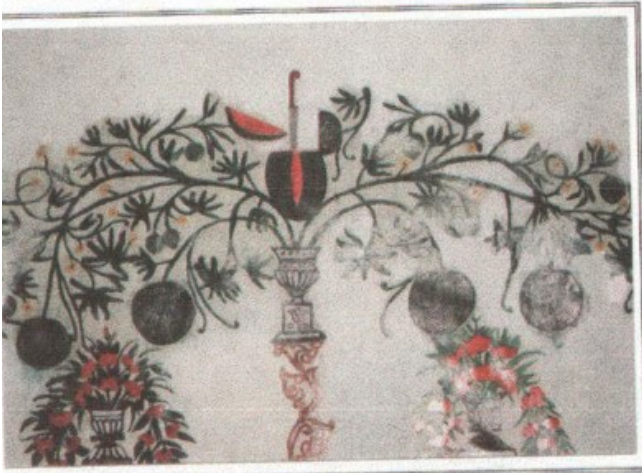
Fotoğraf 7. Amasya-Gümüşhacıköy, Sarayözü Köyü Pır Ali Bircivan Türbesi, resimler 1902 tarihli, Mescit kısmının duvarında, bostan görünümünde bütün ve dilimlenmiş karpuz tasvirleri (Özkan, 2001: Fot. 118).