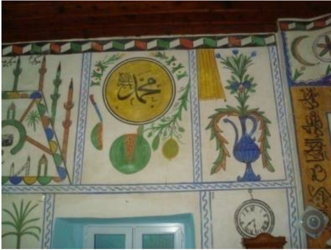
Fotoğraf 5. Afyon-Dazkırı, İdris Köyü Camii, resimler 1913 tarihli, güney duvar doğu kısmında dilimlenmiş, dilimine bıçak saplı, yapraklı karpuz tasviri (Şener, 2011: Foto. 23)