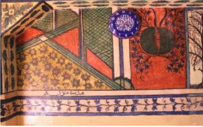
Fotoğraf 14. Manisa-Demirci, Ahatlar Camii, 19. yüzyıl, Batı duvarda iki bıçak saplı, dilimlenmiş, yapraklarıyla karpuz tasviri (Eryılmaz ve Yıldız, 2020: Fotoğraf 37).