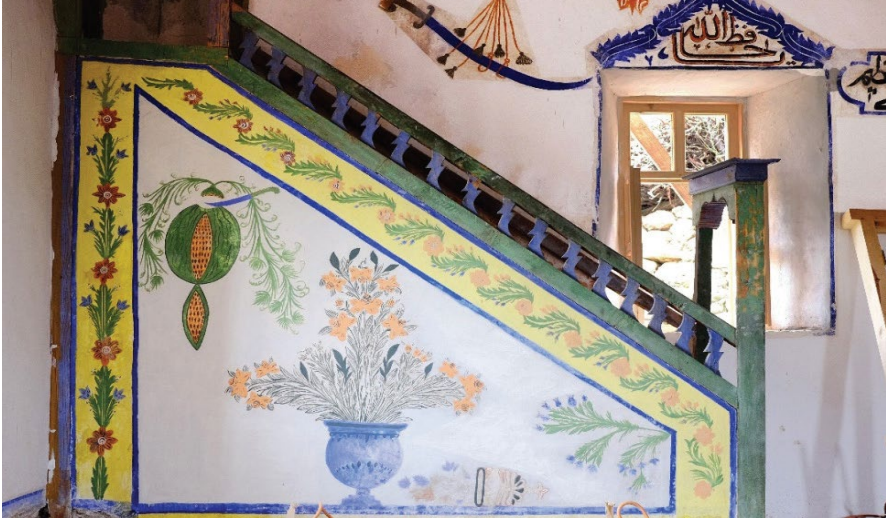
Fotoğraf 4. Manisa-Demirci Küpeler Köyü Camii, süslemeler 1890 tarihli, Minber aynalığında dilimlenmiş, bıçak saplı ve yapraklı karpuz tasviri (Gürbıyık, 2020: G. 13.)