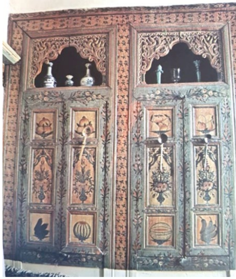
Fotoğraf 12. Tokat, Madımaklar Konağı (Madımağın Celal'in evi) 20. yüzyıl ortası, Başodada ahşap dolap kapakları üzerinde karpuz tasvirleri (Çal, 1998: Fotoğraf 12).