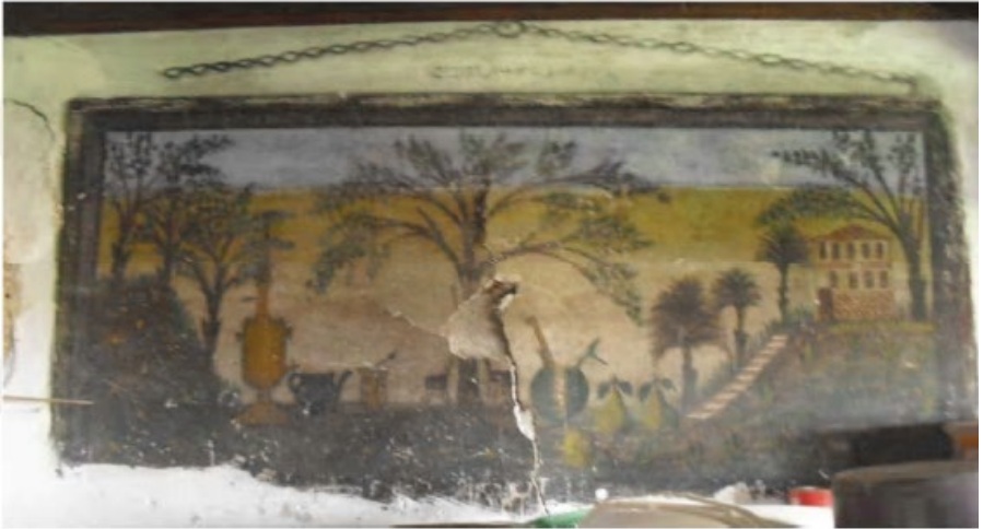
Fotoğraf 9. Yozgat, Lök Köyü Karacabey Konağı, 1910 tarihli, Mucurlu Nakkaş Hacı Ahi, Alt kat oturma odası duvarında dilimli ve bıçak saplı karpuz tasviri (Acun, 2005: 429).