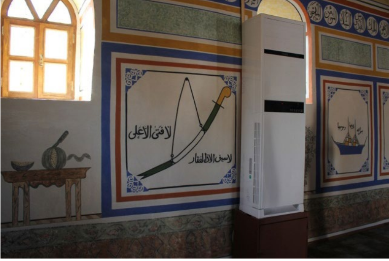
Fotoğraf 15. Yozgat, Tekkeynicesi Köyü Eski Camii, Resimlerin tarihi 1952, Batı duvarda sehpa üzerinde bir dilimi çıkarılmış, bıçak saplı karpuz tasviri (Arslan, 2020: Fot. 22)