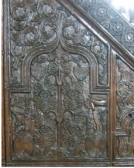
Fotoğraf 11. Artvin-Borçka, Muratlı (Maradit) Köyü Camii, 1846 tarihli, Ahşap kabartma minber aynalığında karpuzla saplanmış bıçağı tutan bir el ve solda karpuzla saplı bıçak tasviri (Taşkan, 2011: Fot. 39).