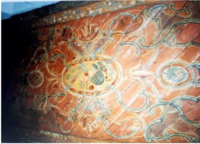
Fotoğraf 13. Yozgat, Paşaköy Bucağı Tokmak Hasan Paşa Cami, 1774 tarihli, Yan sahnin tavanında tepesi kesilmiş, bıçak saplı diğer meyvelerle karpuz tasviri (Acun, 2005: Fotoğraf 692).