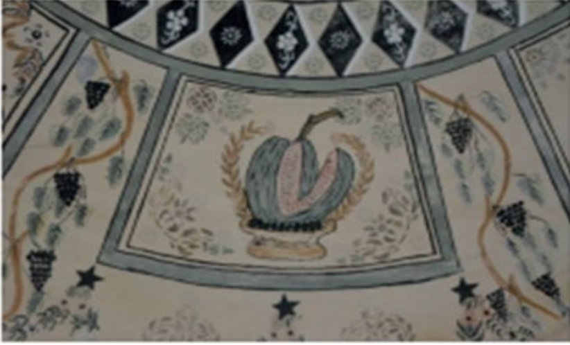
Fotoğraf 6. Kosova-Yakova, Hacı Şeyh Musa Tekkesi, 1870'ler, kubbe içinde dilimli ve bucaak saplı karpuz tasviri (Karaaslan, 2020: Fot. 8).