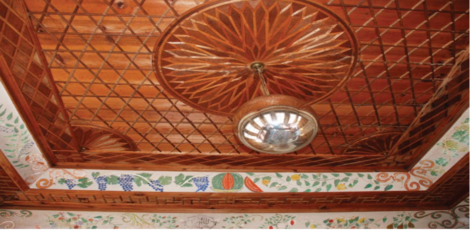
Fotoğraf 10. Safranbolu, Yörük Köyü Sipahizâdeler Konağı, 1877 tarihli, Başodada tavan eteğinde dilimlenmiş karpuz tasviri (Demiraraslan, 2011: Fotoğraf 14).