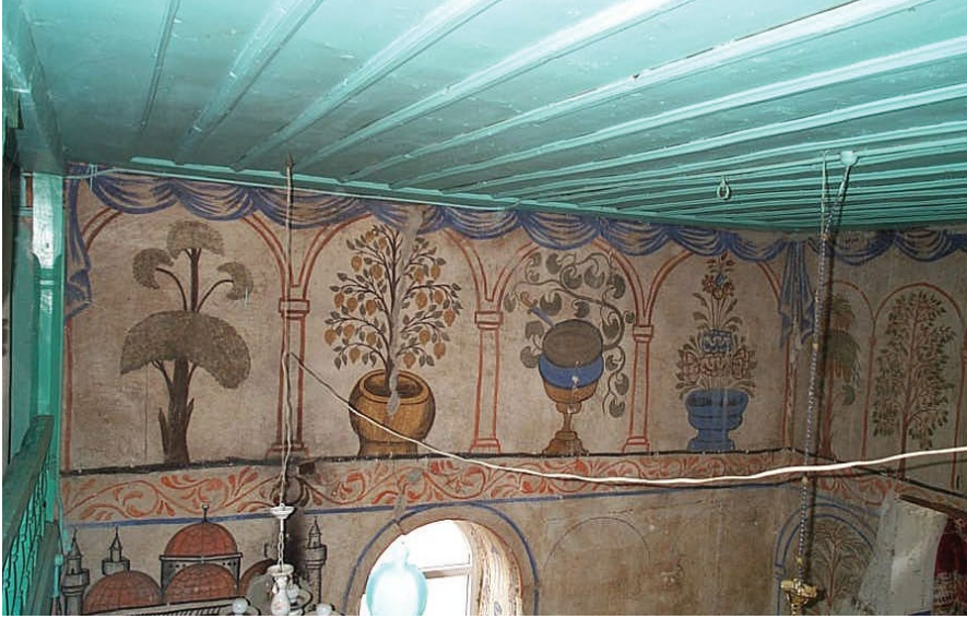
Fotoğraf 3. Giresun, Tekke Köyü Hacı Abdullah Halife Camii, Doğu duvarda vazoda içinde yapraklarıyla bütün karpuz tasviri (İltar, 2014: Fotoğraf 21).