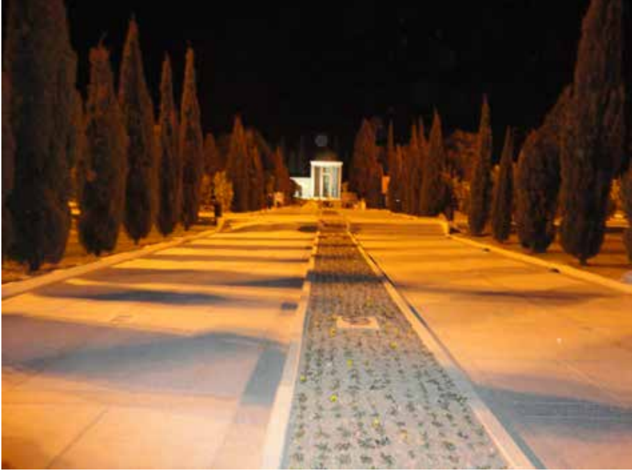
Resim 10: Sadi Şirazi'nin kabri