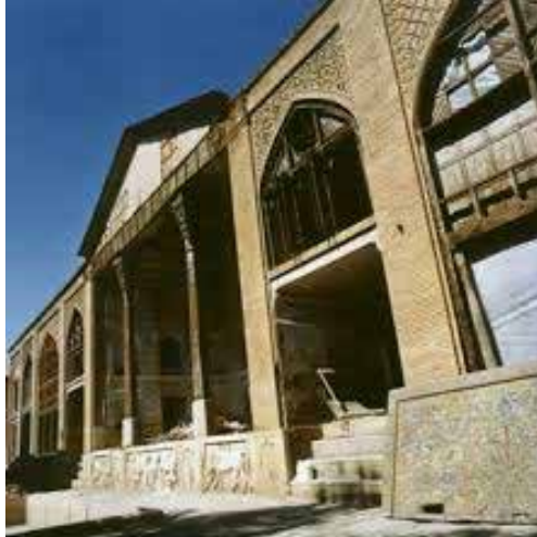
Resim 3: Divanhane

Divanhane Şiraz'ın tarihsel ve kültürel dokularından birisi olarak seyyahların oldukça ilgisini çekmektedir. Kaçarlar döneminde posta ve telgraf merkezi olarak kullanılmış olan bina, mukarnas, taş ve nakış bakımından Zend döneminin mimari özelliklerini yansıtmaktadır. Burası Kaçarlar, Pehleviler ve İran İslam Cumhuriyeti zamanında bir kaç defa bakım ve onarımdan geçirilmiştir. (Nasr, 1387: 48).