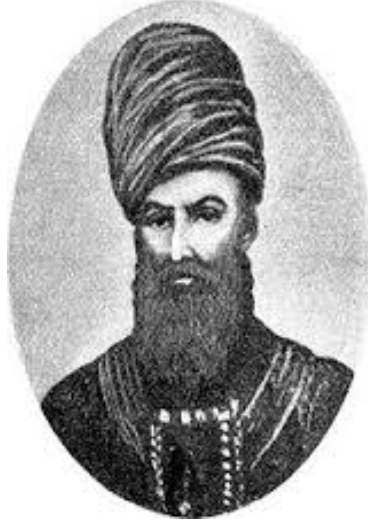
Resim 1: Kerim Han Zend

mescitler, su yolları, bağlar, pazarlar ve kervansaraylar inşa ettirdi. Hatta bu binalar öyle sağlam bir şekilde inşa edildi ki, Şiraz'da ara ara meydana gelen depremlerden bu binalar çok ciddi zarar görmedi (İslâmî: 1351: 7). Kutsal yerlerin bakım ve onarımını yaptırdı. Ülke ekonomisi el verdiği ölçüde, bütün Şiraz'ı bünyâd , halkın gönülünü ise âbâd eyledi. Kerim Han'ın Şiraz'a katkısı, Safevi hükümdarı Şah Abbas'ın İsfahan'ı inşasındaki rolüyle boy ölçüşemese de göz ardı edilemez.