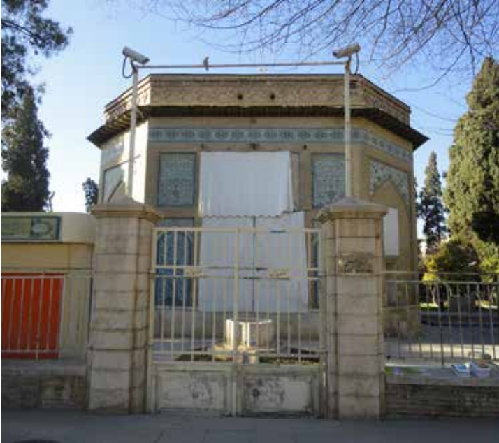
Resim 4: İmaret-i Külâh Frengi

İmaret-i Külâh -ı Frengi bugün Şiraz'da Hıyâbân-ı Kerim Han caddesi üzerinde, Şüheda Meydanı'na yakın ve Erg-i Kerim Han ile karşı karşıyadır (Gülşenî, 1388: 387).