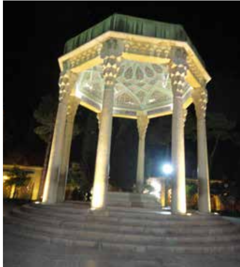
Resim 9: Hafız-ı Şirazi'nin kabri

Sadi Şirazi, Firdevsi, Ömer Hayyam ve Hafız ile birlikte sadece İran'ın değil, belki tüm dünyanın en büyük şairlerinden biri olarak bugün hala büyük bir saygı görmektedir. Şiraz'da vefat eden Sadi'nin türbesi ilk olarak Hoca Şemseddin Muhammed tarafından basit bir şekilde yapılmıştı. Kerim Han türbeyi hem kendisinin hem de Sadi Şirazi'nin şanına yakışır bir şekilde yeniden yaptırdı. Burası Zend döneminin hemen tüm eserleri gibi kerpiç ve kireç harcından yapılmıştı. Türbe Zendlerden sonra Kaçarlar zamanında 1800'lerde ve ardından Muhammed Rıza Şah Pehlevi zamanında büyük bir onarımdan geçirildi (Nasr, 1387: 73-74; İmdad, 1389: 28; Nevai, 1391: 262-263).