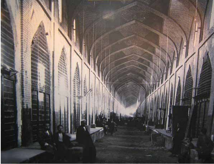
Resim 7: Bâzâr-ı Vekil'in iç görünümü

Kaçarlar devrinde başkentin Şiraz'dan Tahran'a taşınmasıyla Şiraz'ın ticari hacminde daralma olduğu izahıtan varestedir (Nasr, 1387: 61).