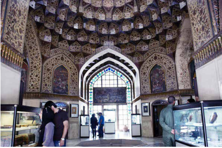
Resim 5: İmaret-i Kûlah Frengi iç görünüm