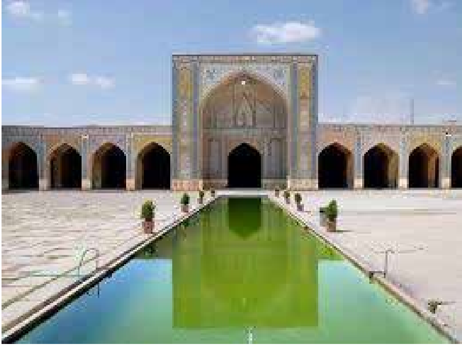
Resim 6: Mescid-i Vekil'in avlusundan bir görünüm

Depremden veya zaman içinde yaşanan yıpranmalardan dolayı Kaçar hükümdarları Fethali Şah ve Nasreddin Şah zamanlarında bakım ve onarım görmüş, çinilerle yeniden tezyin edilmiştir (Nasr, 1387: 50). Hatta mevcut çinilerin Kaçarlar döneminde yapıldığı Kerim Han zamanında yapılan çinilerden herhangi bir eser kalmadığı iddia edilmektedir (Nevai, 1391: 259).