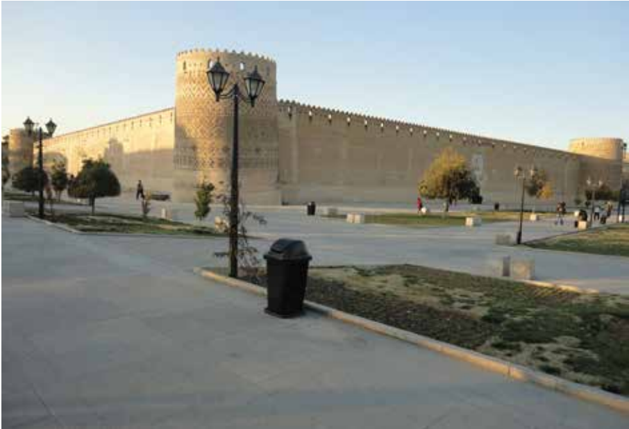
Resim 2: Erg-i Kerim Han