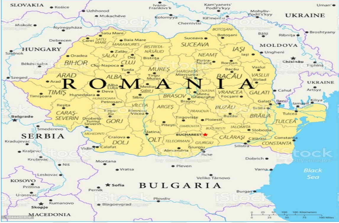
Şekil 1. Romanya Coğrafi Haritası.

Balkanlar veya Balkan Yarımadası ismini, batıdan doğuya kadar uzanan Bulgaristan bölgesini ikiye ayıran sıradağlardan alan Balkan Yarımadasının doğu, güney ve batı sınırları konusunda görüş birliği varken, kuzey sınırları hakkında tam bir görüş hakim değildir. Kimileri Kuzey sınırını Karpatlardan başlatmakta kimileride Tuna ve Drava nehrinden itibaren başlatmaktadır. Geçmişte bu bölgede ki sıradağlar için kullanılan Balkan kelimesi daha sonradan o bölgenin adı olarak kalmıştır. Bazıları da o bölgeye Güneydoğu Avrupa olarak telaffuz etmektedir. Bu isim biraz siyasi olarak ortaya atılmıştır. Balkan sözcüğü tüm dillere Osmanlı Devletinden geçmiştir. Bölgeyi dikkatlice incelediğimizde, yükselen sıradağlar şeklinde ki sarp dağlık alan en dikkat çeken özelliği olarak karşımıza çıkmaktadır. Dağların uzanma biçimi, nehirlerin Tuna'ya veya güney bölgesinde ise Ege Denizine dökülmesini gösterir. Dağların bu şekilde uzanması ve aralarında sarp geçit vermeyen yer olması Balkan Yarımadasında yaşayan insanların aralarında din, dil, etnik köken ve kültür olarak farklı bir gelişme göstermesini sağlamıştır.