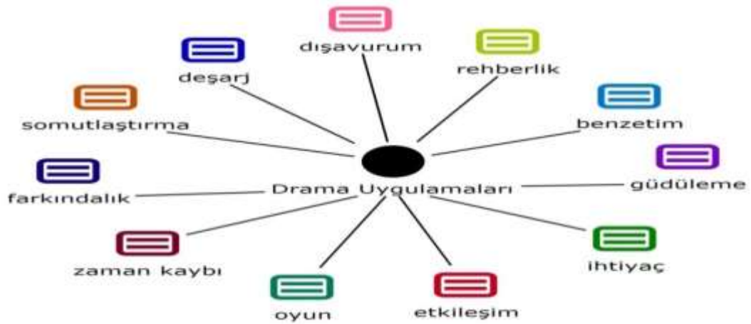
Şekil 1. Drama Uygulamaları Kod Haritası

Türkçe öğretmen adaylarının drama uygulamalarına yönelik oluşturdukları metaforlar ışığında drama uygulamalarına yönelik ortaya çıkan kod haritası aşağıda gösterilmiştir