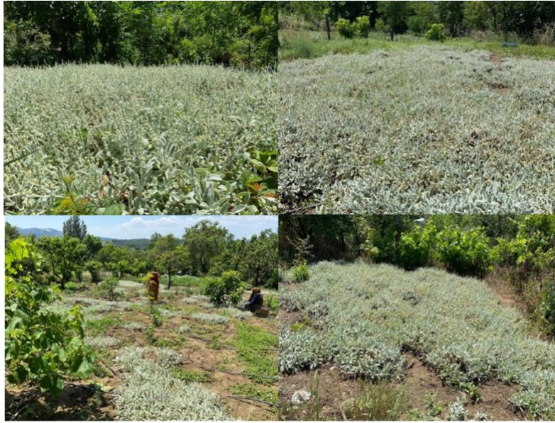
Şekil 4. Farklı bahçelerde kültürü yapılan Sideritis trojana .