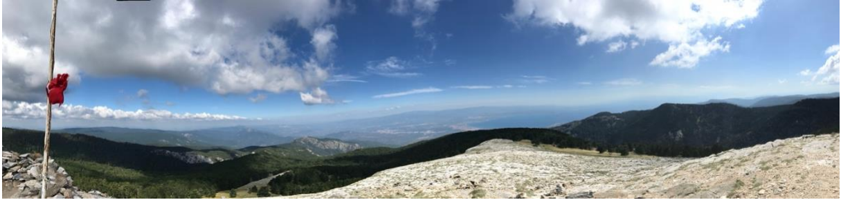
Şekil 2. Sarıkıztepe'den Edremit Körfezinin görünüşü.

Ticari öneme sahip endemik bitkiler, tıbbi ve araştırma amaçlı çok yoğun ilgi görmektedir. Dünyanın farklı araştırma kuruluşlarında yürütülen araştırmalar ve herbaryum örnekleri için önemli miktarda bitki örneği toplanmaktadır. S. trojana sınırlı alanlarda yayılış gösterirken, yabancı hayvan baskısı, düşük tohum çimlenme kabiliyeti ve iklim değişikliği gibi doğal etmenler yanında insan faktörü nedeniyle de nesli tükenme riskini olan türler arasındadır (Satıl, 2009). Uluslararası Doğayı Koruma Birliği (IUCN) tarafından 1998 yılında yayımlanan Kırmızı Listede küresel popülasyonları tükenme riski ile karşı karşıya olan türler arasında nadir (R) türler arasında yer almaktadır (Walter ve Gillet, 1998). S. trojana 'nın günümüzde tehlike altındaki (EN) sınıfta değerlendirildiği görülmektedir (Satıl, Dirmenci vd., 2006). Endemik bitkilerin iklim değişimi baskısı yanında bilinçsizce yapılan toplamalarda yok olma tehlikesini hızlandırmaktadır (Surasinghe, 2010).