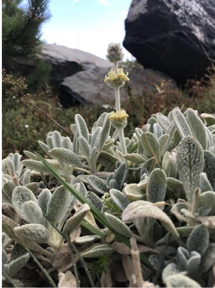
Şekil 1. Sideritis trojana 'nın doğal yayılış alanında genel görünüşü.

S. trojana , geçirgen yapılı, organik maddece zengin, yamaç ve kaya sırtlarında yetişir. Kazdağı'nın Edremit Körfezine bakan yöneyinde bulunabildiği gibi kuzeye bakan Çanakkale Bayramiç İlçesi yöneyindeki yamaçlarda da görülür (Öztürk vd., 2011). S. trojana , Sarıkıztepe, Tavşanoynağı, Tozlu, Nanekırı, Susuztepe, Uzunoluk-Sarıot, Karataş-Babatepe ve Düden mevki çevresinde 1200-1774 metre yükseklikteki doğal florada yayılış gösterir (Şekil 6) (Türkmen 2019; Uysal vd., 1991). Sarıkıztepe ile Tozlu yayla formasyonunda serpantin kayaçları yer alırken, sarıkızçayı bitkilerinin bu alanda yayılış gösterdiği ayrıca bu bölgede endemizmin yaygın olduğu bilinmektedir (Avcı, 2005; Şentürk ve Ünlü, 2009).