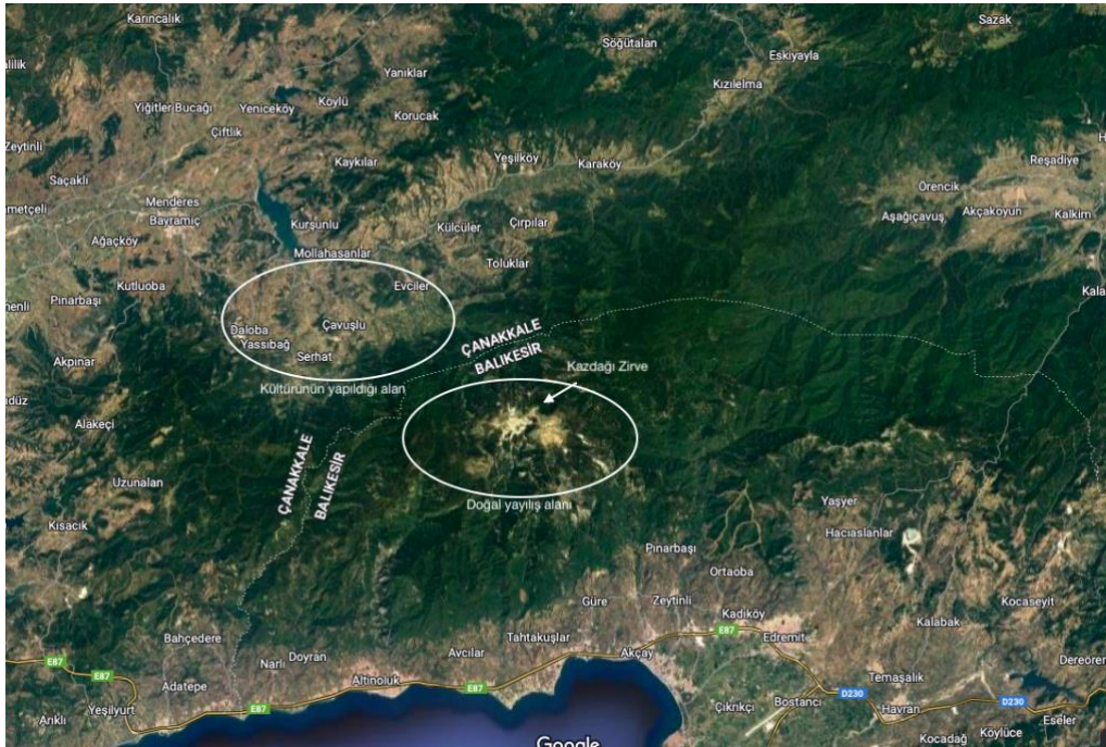
Şekil 6. Satureja trojana doğal yayılış ve kültürünün yapıldığı alanlar.