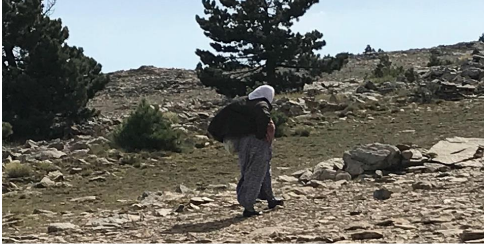
Şekil 3. Sarıkıztepe'den topladığı sarıkızçayı bitkilerini heybesinde taşıyan köylü kadın.

gençleşmesine katkı sağlar. Toplayıcılar, geleneksel tıp ve etno-botanik unsur günümüze ulaştırılmasında kültürel bir misyon da gerçekleştirir (Kendir ve Güvenç, 2010; Çakmaklı ve Daşdemir, 2019). Milli park sınırlarında doğadan bitki toplanmanın önüne geçilmesi, yöredeki dağ köylerinin sosyo-ekonomik şartlarını sınırlamıştır. Diğer yandan endemik bitkilere yörede dışındaki insanların da artan ilgisi ve bitki üzerindeki kontrolsüz toplama baskısı ile S.trojana 'nın yok olmas riskini arttırmıştır (Türkmen, 2019).