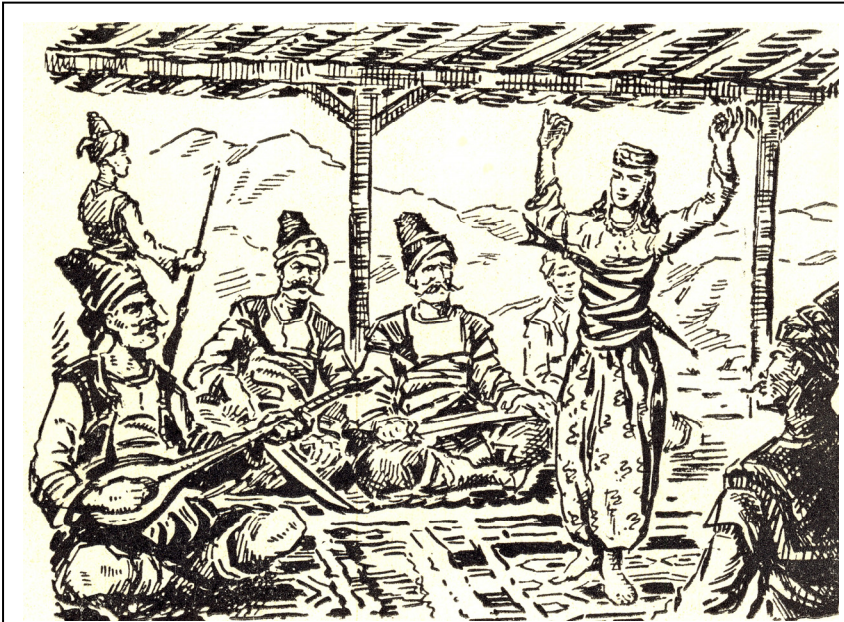
Reşad Ekrem Koçu'nun Dağ Padişahları kitabından