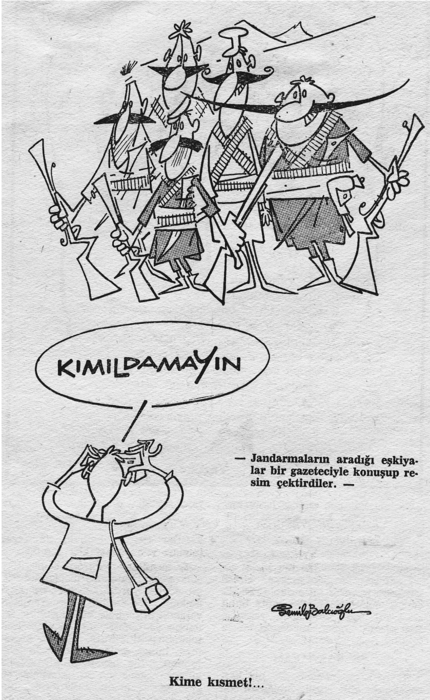
Semih Balcıoğlu Akbaba - 9 Ağustos 1967