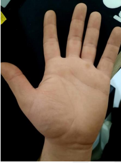
Resim 3. El Falı Örneği

çizgiye ise akıl çizgisi denir. Bu çizgi sahip olunan ya da olunacak başarılar hakkında fikir verir. Avucun sağ dış kısmından başlayarak orta parmağın altına doğru uzanan çizgi ise en üstte yer alan kalp çizgisidir. Bu çizginin yapısı, sosyal yaşantıdaki sevgiyi, barışı temsil eder. (KK 5)