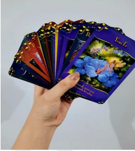
Resim 2. Kart Falı Örneği

Soru-cevap şekliyle ilerlenen kart falında net sorular sorulur. Fala bakmadan önce fal baktıran kişinin; doğum saati, yılı, ayı ve günü öğrenilir ve fal bakan kişi desteleri karıştırır. Desteler önce ikiye ayrılır. Sonra ikiye ayrılan kartlar karıştırılır ve kart seçilmesi istenilir. İlk başta on kart seçilir. Seçilen kartlar yorumlanır. Ardından baktıran kişinin soruları, kartlara sorulur ve kartla yorumlanır. Sorular net ve açık olmalıdır. Örneğin, “Doktorayı Hacettepe Üniversitesi’nde yapacak mıyım?” gibi. Sorular bittikten sonra kartlar kapatılır ve kaldırılır.