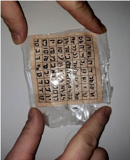
Resim 7. Evli Çiftleri Ayırma Büyüğü

Makas, bir şeyi kesip ayırmak amaçlı kullanılır. Büyüde de kullanılan makas, iki kişi arasındaki sevgi ve saygı bağı keser. Araştırmacı olarak katılan bu büyü çeşidine sıklıkla kaynanalar başvurur.