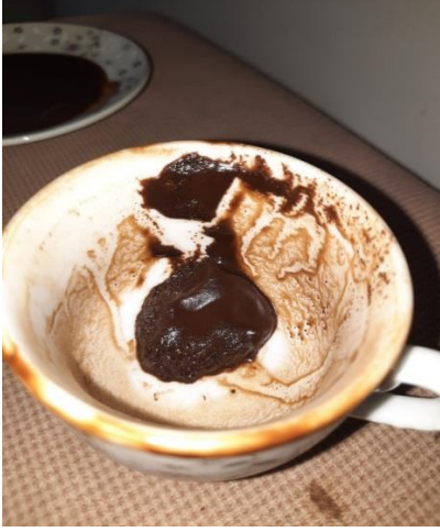
Resim 1. Kahve Falı Örneği

KK15 ve KK16 kahve falı baktıklarını ve fal bakarken de esasen herhangi bir nesneye ihtiyaç duymadıklarını, kalp gözüyle fal baktığını ve cinlerle de bağlantılarının olmadıklarını belirtti. ( KK 15, KK 16)