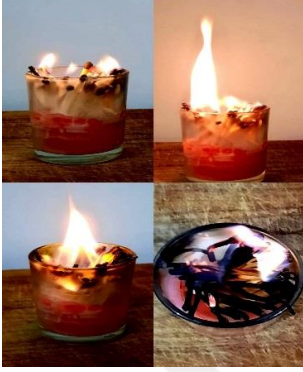
Resim 4. Ateş Falı Örneği

verirdim. Ateş falına baktıktan sonra baktıran kişinin etrafına su ile çember çizilir. Daha sonra fal baktıran kişiden bir adakta bulunması istenir. Ben genelde adak olarak on tane aç insanı doyurmasını isterim. Fal baktıran kişi adakta bulunduktan sonra üstüne su serperim. Ateşin gücü üzerinden alınsın diye.” şeklinde yapılan ritüelleri aktarıldı.( KK 23)