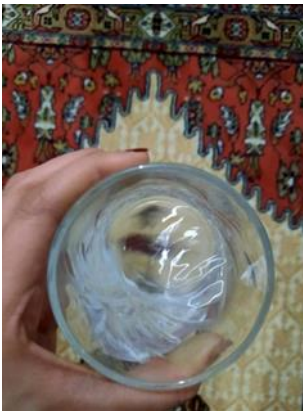
Resim 5. Su Falı Örneği

Çanakkale Merkez’de su falı çok nadir olarak bilinir. Su falına herkes bakamayacağı, sadece su cinleri olan kişilerin bakacağı ifade edilir. Su falına cinlerle bakılmadığı inancı mevcuttur. Bunun nedeni ise cinlerin ateşten yaratıldığı inancıdır. Eğer cinler suya gelirse öleceklerine dair bir inanç mevcuttur. (KK 3) Su ile bir başka ifade kötü cinlerin suya gelmeyeceklerine dair inanış mevcut olduğudur. (KK 6)