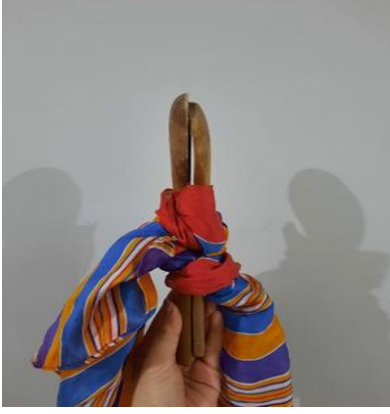
Resim 8. Birini Kendine Bağlama Büyüsü

Kaşıkla yapılan büyüler istenilen herhangi bir zaman diliminde yapılabilir. Kaşık büyüünde kullanılan temel malzemeler, iki adet tahta kaşık, kırmızı kurdele, yapılan kişinin ismi, yapılan kişinin annesinin ismi ve mezardır. Kaşık büyüü yapılırken öncelikle her iki kaşığın üstüne de otuz üç bin defa büyüsel dualar okunur. Ardından kaşıkların iç kısmı birbirine bakar duruma getirilip kırmızı kurdeleyle bağlanır. Büyülü kaşıklar gündüz vakti, kadın-erkek mezarı fark etmeksizin herhangi bir mezara gömülür fakat kadın mezarına gömülmesi daha çok tercih edilir. Eğer büyü yapılan kişi, büyü yaptıran kişiye dönmez ise sonunun ölüm olduğuna inanılır. Bunun nedeni topraktır çünkü toprak ölümle sembolize edilir 13 .