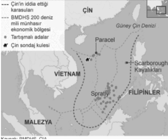
Harita 1: Güney Çin Denizi Sorunu